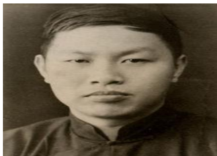
WATCHMAN NEE

Mikä on totta universaalisesta Seurakunnasta, on myös totta paikallisseurakunnasta. Universaalinen Seurakunta käsittää kaikki ne, joilla määrätyllä paikkakunnalla on Hengen yhteys. Jumalan Seurakunta ja Jumalan Seurakunnat eivät eroa luonteeltaan, vaan ulottuvaisuudeltaan . Edellinen käsittää maailmankaikkeudessa kaikki ne, joilla on Jumalan Henki, jälkimmäinen käsittää kaikki ne, joilla on Jumalan Henki samalla paikkakunnalla . ...Useimmat nykyajan uskovat ovat kokonaan sokeita, kun on kysymyksessä seurakunnan raamatullinen peruste ... Paikkakunnan ero yksin oikeuttaa uskovien välisen jakaantumisen (133-135).